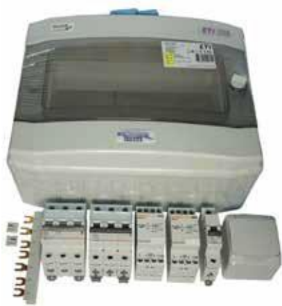
PAHLEN COMPACT 6 kW LÄMMITTIMEN ASENNUSSARJA 152 €