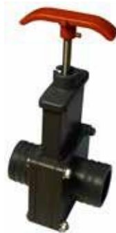
38 mm HANA 20 €