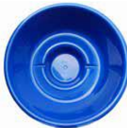
2000x950 PALJUT 1500 L 769 €