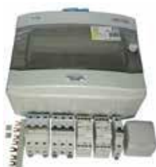
PAHLEN COMPACT 6 kW lämmittimen asennussarja 152 €

Laitteet (3 kW ja 6 kW sähkövastus, suodatinjärjestelmä) toimitetaan valmistajan pakkauksessa ja ne tulee asentaa paikan päällä. Sähkökytkennät voi tehdä vain vastaavan alan asiantuntija.