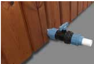
VEDENPOISTO HANA 20 €