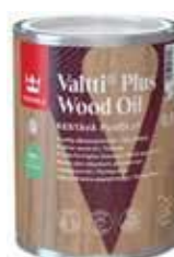
VALTTI PLUS PUUÖLJY 0,9 L (kulu: 5–10 m 2 /L) harmaa, ruskea, väritön 12 €