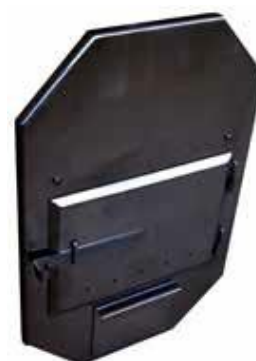
37 KW KAMIINAN ETUPANEELI teräs (musta) 66 €