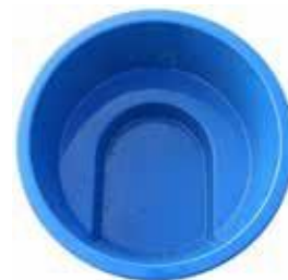
1750x960 PALJUT 1100 L 596 €