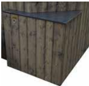
SUODATINJÄRJESTELMÄN KAAPPI puu 420 € komposiitti 528 € lämpökäsitelty puu 474 € kaapin eriste 120 €