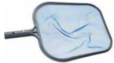
UIMA-ALTAAN PUHDISTUSKAHVA 7 €