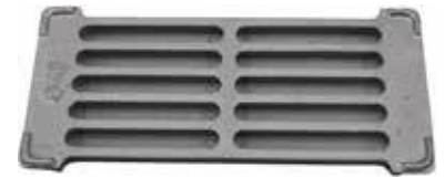
TUHKA-ARINA 25/30 KW 11€ 50/60 KW 22 €