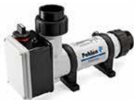
PAHLEN COMPACT 6 kW:n LÄMMÖNPITOJÄRJESTELMÄ 352 €