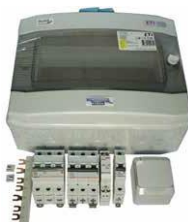
PAHLEN AQUA HL 6 kW LÄMMITTIMEN ASENNUSSARJA 114 €