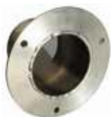
38 mm LÄPIVIENTI 10 € 50 mm LÄPIVIENTI 10 € 76 mm LÄPIVIENTI 14 € Asennus 1kpl 15 €