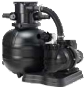
SUODATIN- JÄRJESTELMÄ 299 €