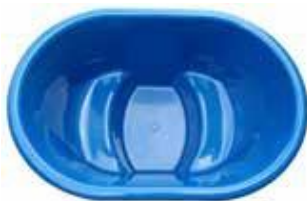
1160x1670x960 PALJUT 800 L 440 €