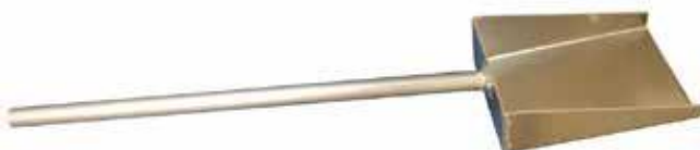
ULKOKAMIINAN TUHKALAPIO 16 €