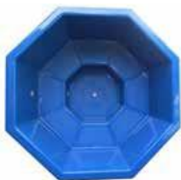
1800x1800x990 PALJUT 1200 L 596 €