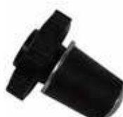
KAMIINAN TULPPA 9 €