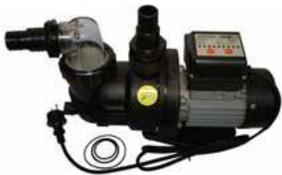
KIERTOPUMPPU 250 W 200 €