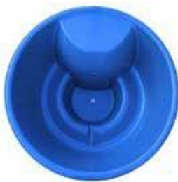
2000x950 PALJUT 1400 L 769 €