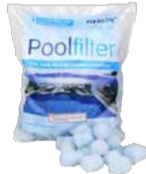
SUODATINPALLOT 48 €