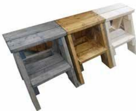
ISO RAPPU kuusi/mänty 150 € lämpökäsitelty 160 €