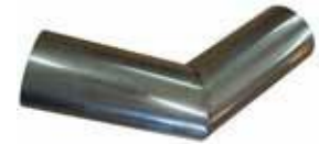
SAVUPIIPUN MUTKA 45* 42 €