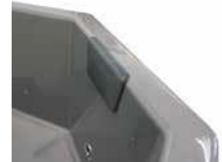
NISKATUKI 35 €