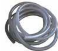
LETKU 76 m m (kamiina) 37 € LETKU 50 m m, 1m (kamiina) 20 € LETKU 38 m m, 0,4 m (suodatin) 3 € LETKU 32 m m, 1m (vedenpoisto) 10 €