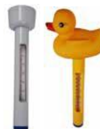
LÄMPÖMITTARI 9 €