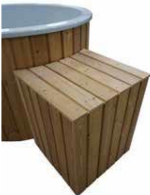
SUODATINJÄRJESTELMÄN KAAPPI kuusi/mänty 223 € lämpökäsitelty puu 245 €