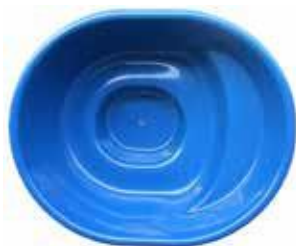
2000x2400x990 PALJUT 1700 L 950 €