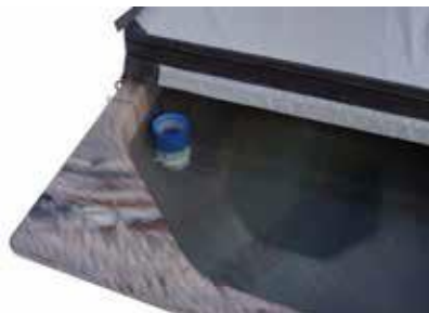
SUODATIN KYLPTYNNYRIIN 170 €