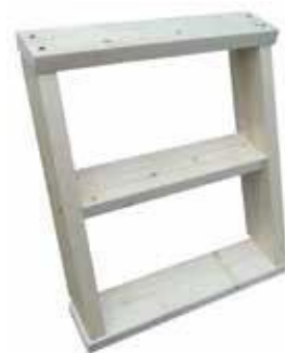
RAPPU: kuusi/mänty 64 € lämpökäsitelty 77 € komposiitti 88 €