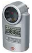
AJASTIN 20 €