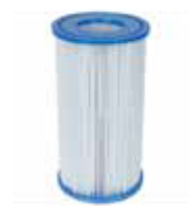
SUODATIN- ELEMENTTI 20 €