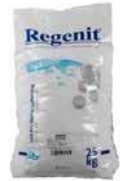
UIMA-ALLAS SUOLA 25 KG 25 €