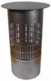
KIPINÄSUOJA 114 m m 68 € 160 m m 75 €