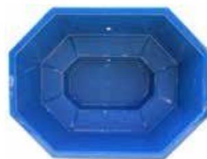
1800x2400x990 PALJUT 1600 L 950 €