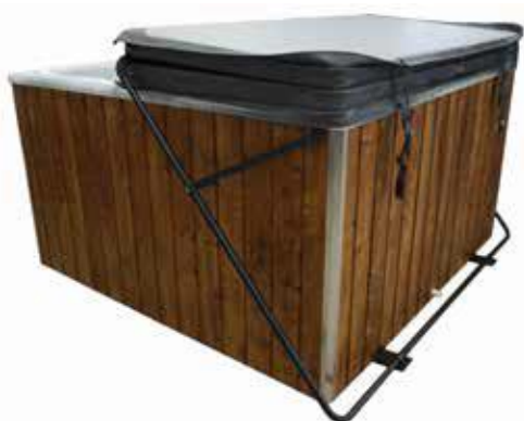
KANSIHISSI (PALJUT 1650 L) 180 €