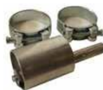
MAGNESIUMANODI KAMIINAAN 30 €