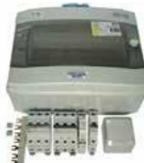
PAHLEN AQUA HL 6 kW lämmittimen asennussarja 114 €