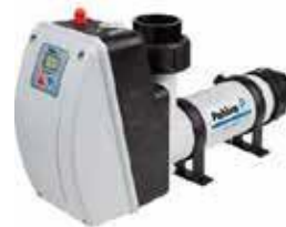
PAHLEN AQUA HL 6 kW:n LÄMMÖNPITOJÄRJESTELMÄ 660 €