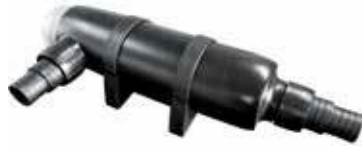
UVC VEDEN PUHDISTUS LAITE 18 W 195 €