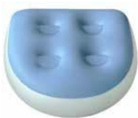
KYLPYTYNNYRIN ISTUINOSAN 15 €