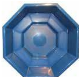
2400x2400x980 PALJUT 2300 L 1082 €