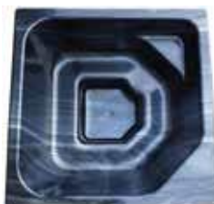
2060x2060x1010 PALJUT 1650 L akryylinen allas 1155 €