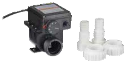
3 kW:n LÄMMÖNPITO- JÄRJESTELMÄ 171 €