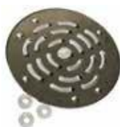
SUODATTIMEN LÄPIVIENNIN SUOJARITILÄ 10 €