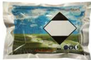
DUTRION-TABLETIT KYLPYTYNNYREIHIN 240 g pakkaus sisältää 20 g tabletteja 12 kpl. 54 € 1000 g pakkaus sisältää 2 g tabletteja 500 kpl. 132 €