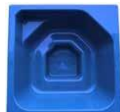
2060x2060x1010 PALJUT 1650 L lasikuituallas 977 €