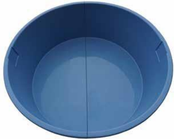
Allas valmiina käytettäväksi.