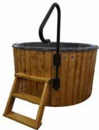
KYLPYTYNNYRIN KÄSIKAIDE 150 €