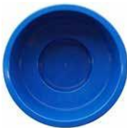
1750x960 PALJUT 1000 L 596 €