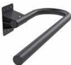
PYYHETELINE 30 €