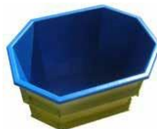
1800x2400x1600 PALJUT 3500 L 2030 €