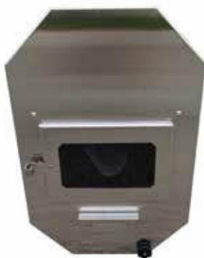
37 KW KAMIINAN ETUPANEELI ruostumatonta terästä 120 €