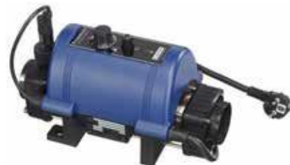
ELECRO 3 kW SÄHKÖLÄMMITTIN (titaani-lämmityselementti) 524 €