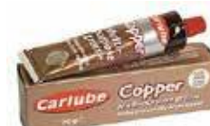
KUPARIRASVA (kamiinan luukulle) 10 €