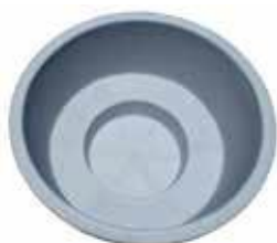
2000x1140 PALJUT 1800 L muovinen (polyetyyleeni) allas + ulkokuori 1231 €